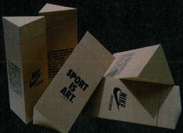
由即日起至5月26日期間，曾試飲NIKE SPORTSWEAR STORE發售的TEE，特別附有三角形盒子作包裝，定價每打為港幣$240。