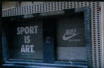
NIKE SPORTSWEAR STORE 銅鑼灣白沙道7號地舖 2577 0703